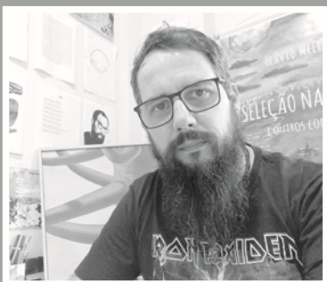
Escrito por Flávio Mello

Escritor, músico e gestor cultural paulistano, com obra marcada por lirismo urbano, crítica social e escuta sensível. Após um acidente na juventude, encontrou na literatura um caminho de reconstrução e expressão profunda. Estabelecido em Siqueira Campos (PR), transformou a cena cultural local por meio de projetos, festivais e políticas públicas, sendo amplamente reconhecido por seu impacto regional. Sua escrita transita entre o realismo brutal e a poesia do cotidiano, abordando temas como infância, fé, masculinidade e resistência. É membro de academias literárias e segue criando, também na música, com um projeto de doom metal filosófico.