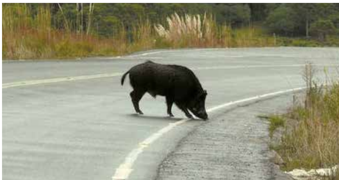
A presença de javalis em rodovias da região tem sido cada vez mais frequente. Na semana passada, foram dois acidentes envolvendo javalis, sendo um deles com vítima fatal

No Paraná, o IAT vem realizando ações relacionadas ao manejo dos javalis buscando promover o controle da espécie. Além do trabalho realizado em parceria com Unidades de Conservação Estadual, também há apoio dos caçadores voluntários devidamente cadastrados no Ibama que ajudam a promover o controle da proliferação destes animais.