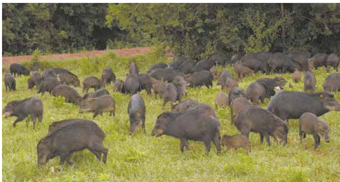
Os javalis costumam viver em bandos e podem facilmente destruir grandes áreas de lavouras de milho, soja, cereais e raízes, além de atacar e transmitir doenças para outros animais

eles encontram para viver na região. "Os javalis apresentam alta capacidade reprodutiva e, além disso, tem uma dieta a base de vários recursos. Devido a se tratar de uma região ligada a agricultura, eles encontram grande disponibilidade de alimentos e áreas de mata que proporcionam um ambiente propício para o crescimento da espécie", destacou. Amanda e Tatielly também explicam de que maneiras estes animais podem afetar a vida da população, princi-