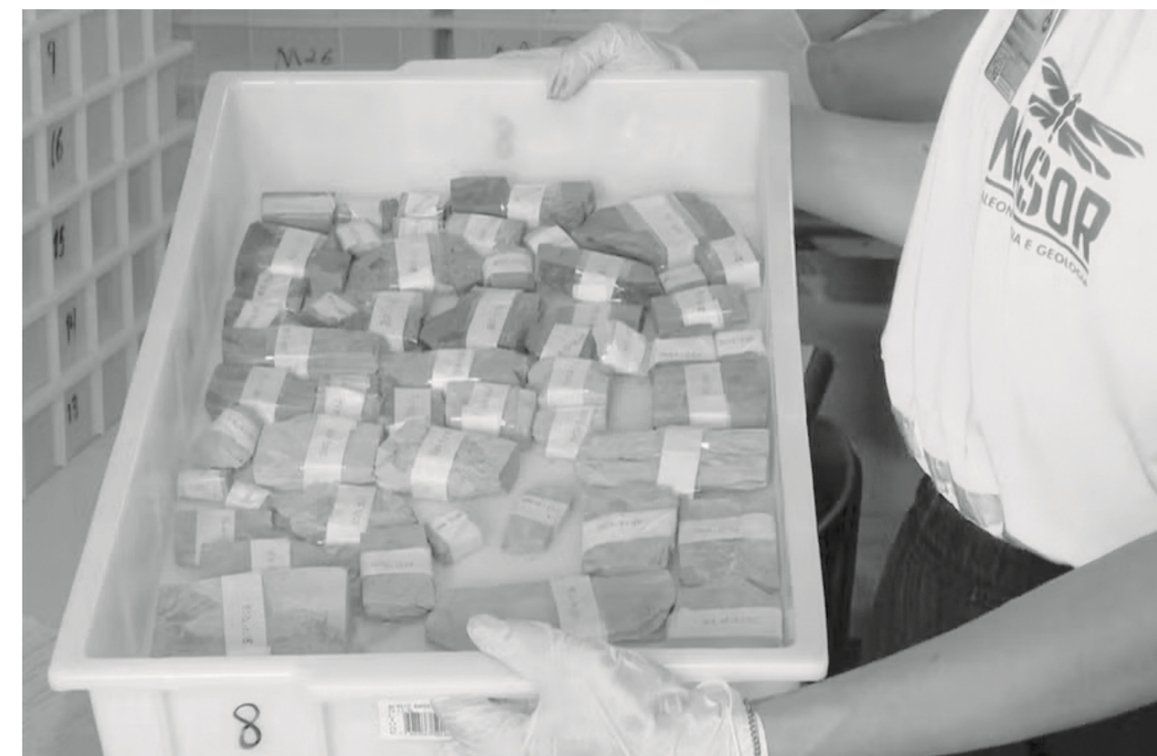
Da Redação Pré-histórico

Mais de 2,6 mil fósseis foram descobertos durante obras de implantação de uma linha de energia elétrica que corta as regiões, passando por cidades como Ponta Grossa, Ibaiti e Curiúva