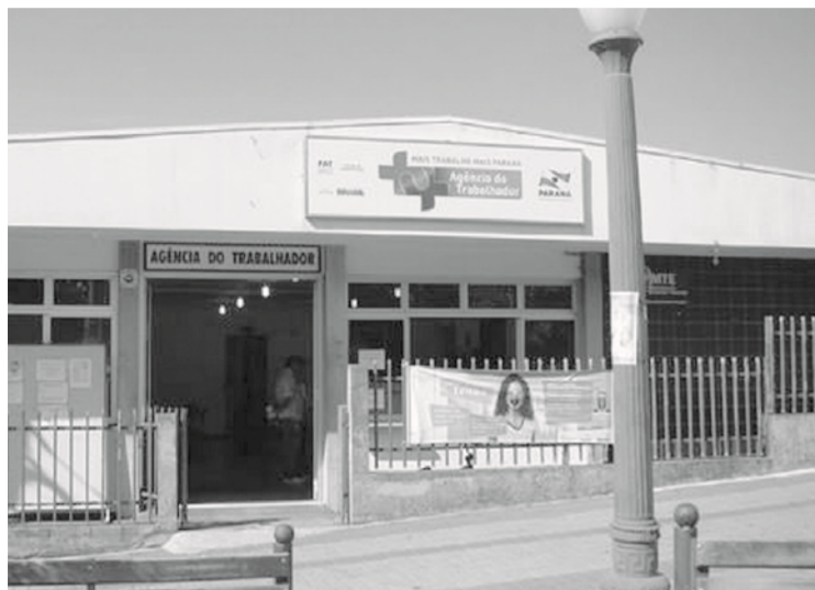
Da Redação Cornélio Procópio

Oportunidades são para supermercados, fábricas, restaurantes e no comércio em geral; veja como participar