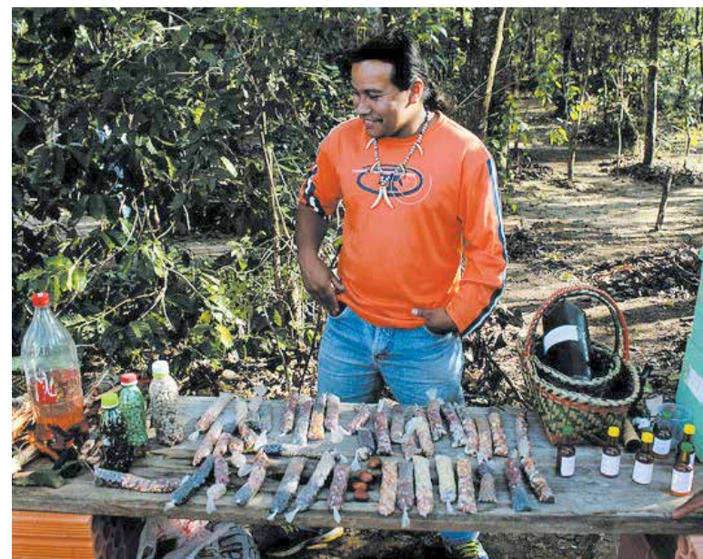
Sementes nativas cultivadas pela comunidade Guarani Nandeva, que habita o território de Tomazina, são um dos exemplos de resistência e luta pela sobrevivência das tradições e culturas dos povos indígenas da região

também começam a incluir essa herança em seus projetos, resgatando histórias que por muito tempo ficaram invisíveis. Hoje, os povos indígenas do Norte Pioneiro seguem mobi-