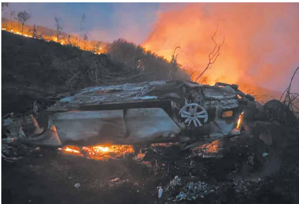
Aeroporto Avelino Vieira tem se transformado em ponto de encontro para manobras arriscadas, um palco de verdadeiras tragédias

"Atualmente aquela área está sob concessão de uma empresa, porém eles não estão cumprindo com as atribuições de trazer segurança para o local. Por isso, a gestão já está em contato para rescindir a concessão e assim que a área retornar aos domínios do município tomaremos medidas para promover o uso ordeiro do local", diz a nota enviada à Folha.