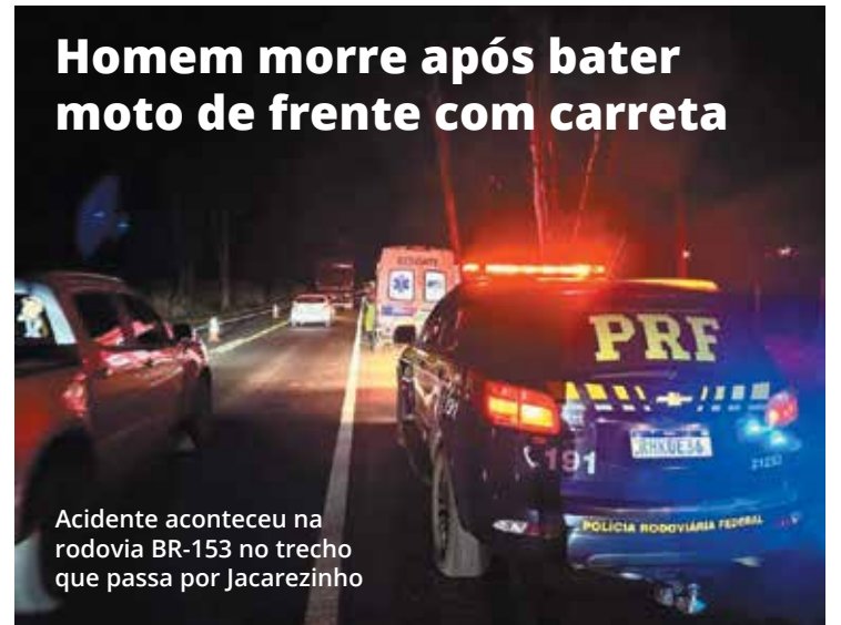
Acidente aconteceu na rodovia BR-153 no trecho que passa por Jacarezinho