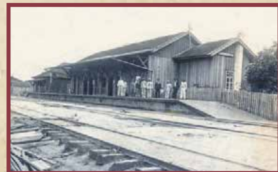
Estação de Wenceslau Braz, cidade que abrigou o Quartel Gerneal das tropas federais

tropas contaram com grande apoio dos moradores de diferentes municípios da região que acabou se envolvendo na guerra, seja de forma voluntária ou por meio de convocação. Estas pessoas ajudavam os soldados com alimentos, vestimentas e deslocamento por meio as matas, além de atuar como soldados, enfermeiros, cozinheiros, carregadores entre outros.