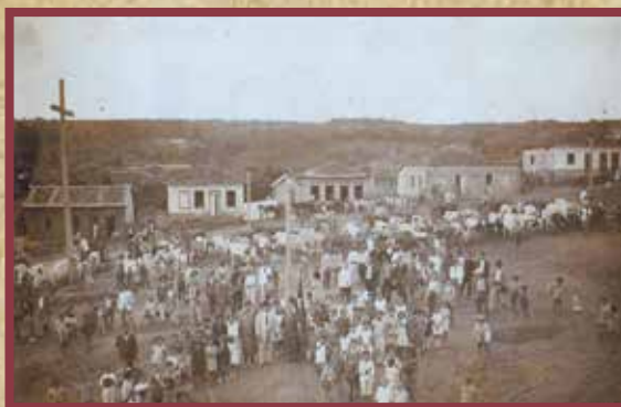
Siqueira Campos, ainda então 'Colônia Mineira', foi palco de uma das principais batalhas