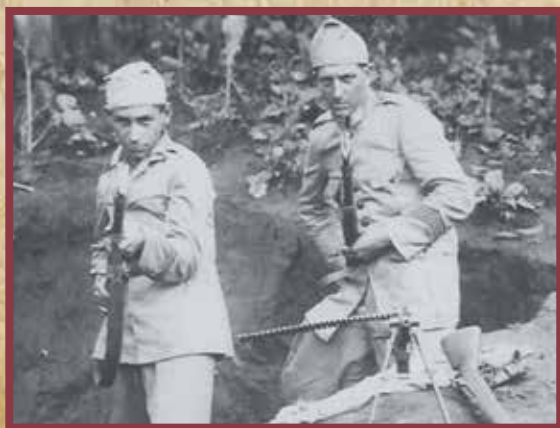
Soldados armados em trincheira durante combates em Jacarezinho

Com base em São Paulo, a Revolução Constitucionalista de 1932 enfrentou forte resistência em solo paranaense, uma vez que o estado do Paraná se manteve leal ao governo de Getúlio Vargas.