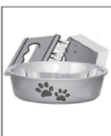
3- LAVE COM ESCOVA OU BUCHA OS POTES DE ÁGUA PARA OS ANIMAIS.