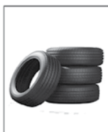
4- PNEUS SEMPRE COBERTOS.