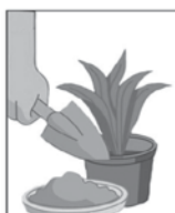
1- LIMPE SEMANALMENTE OU PREENCHA PRATOS DE VASO DE PLANTAS COM AREIA.