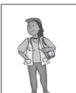
6- Atenda os agentes comunitários de saúde e agentes de endemia.