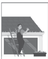
5- Não esqueça da limpeza em calhas, piscinas, ralos e em plantas tipo bromélias.