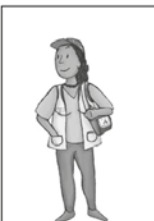
6- Atenda os agentes comunitários de saúde e agentes de endemia.