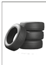
4- PNEUS SEMPRE COBERTOS.