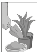
1- LIMPE SEMANALMENTE OU PREENCHA PRATOS DE VASO DE PLANTAS COM AREIA.