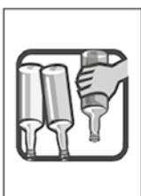
2- DEIXE GARRAFAS SEMPRE VIRADAS COM A BOCA PARA BAIXO.