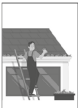
5- Não esqueça da limpeza em calhas, piscinas, ralos e em plantas tipo bromélias.