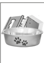
3- LAVE COM ESCOVA OU BUCHA OS POTES DE ÁGUA PARA OS ANIMAIS.