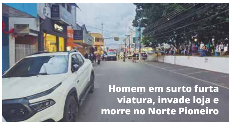
Homem em surto furta viatura, invade loja e morre no Norte Pioneiro

Em uma mistura de sentimentos, diretores expressam gratidão e orgulho dos estudantes; veja o que a cerimônia significou para cada um