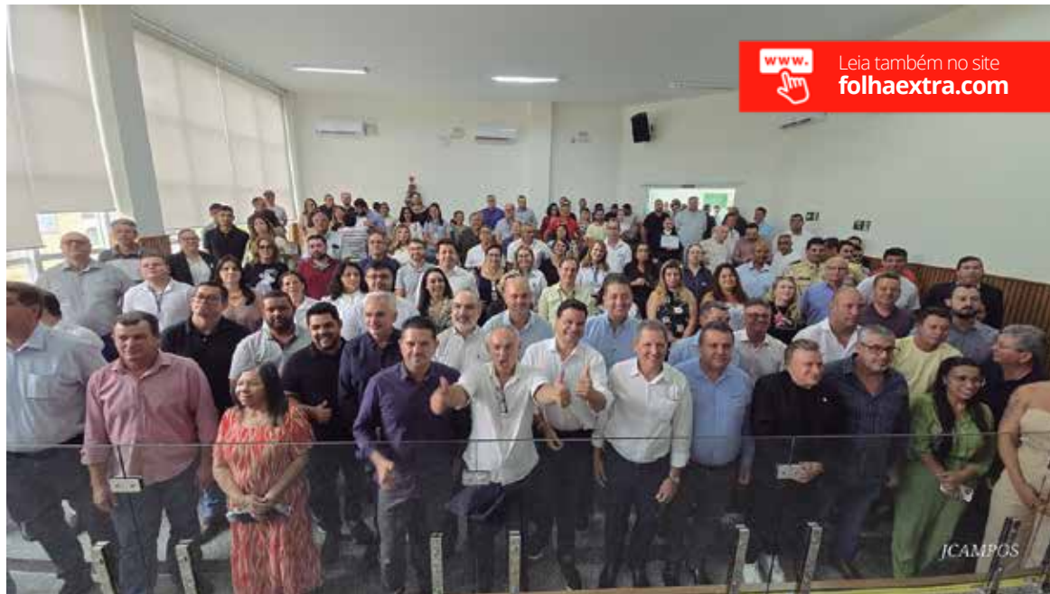
Encontro foi realizado na última sexta-feira na sede da Câmara de Vereadores de Joaquim Távora Foto: Divulgação.

Um dos principais temas abordados durante a reunião foi o processo de duplicação da rodovia, que significa um passo importante para a região, sendo considerado