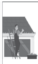
5- Não esqueça da limpeza em calhas, piscinas, ralos e em plantas tipo bromélias.