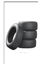
4- PNEUS SEMPRE COBERTOS.