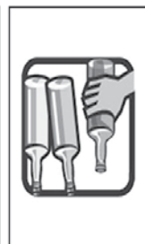
2- DEIXE GARRAFAS SEMPRE VIRADAS COM A BOCA PARA BAIXO.