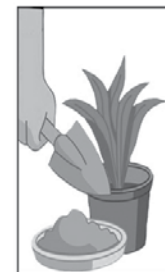
1- LIMPE SEMANALMENTE OU PREENCHA PRATOS DE VASO DE PLANTAS COM AREIA.