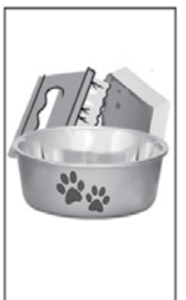
3- LAVE COM ESCOVA OU BUCHA OS POTES DE ÁGUA PARA OS ANIMAIS.