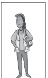
6- Atenda os agentes comunitários de saúde e agentes de endemia.