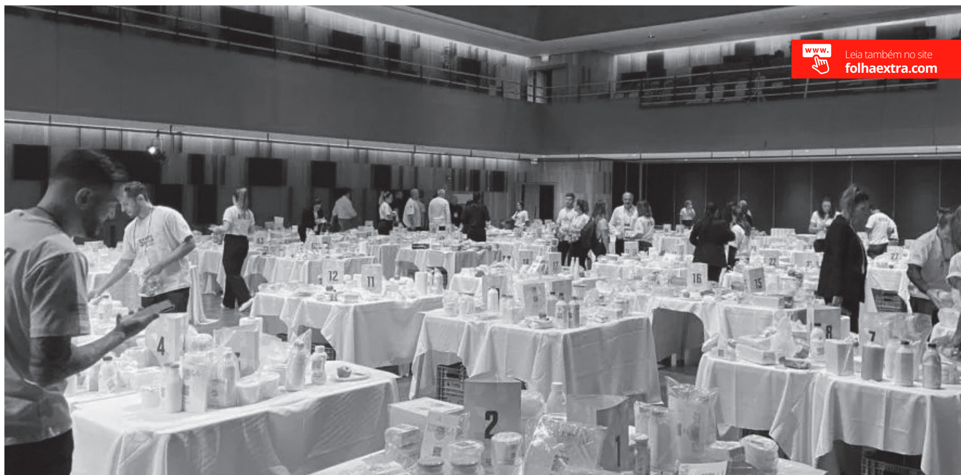
Premiação Queijos do Paraná inicia preparativos para segunda edição

Segunda edição da competição deve ser lançada oficialmente em 18 de setembro, com expectativa de 600 produtos participantes