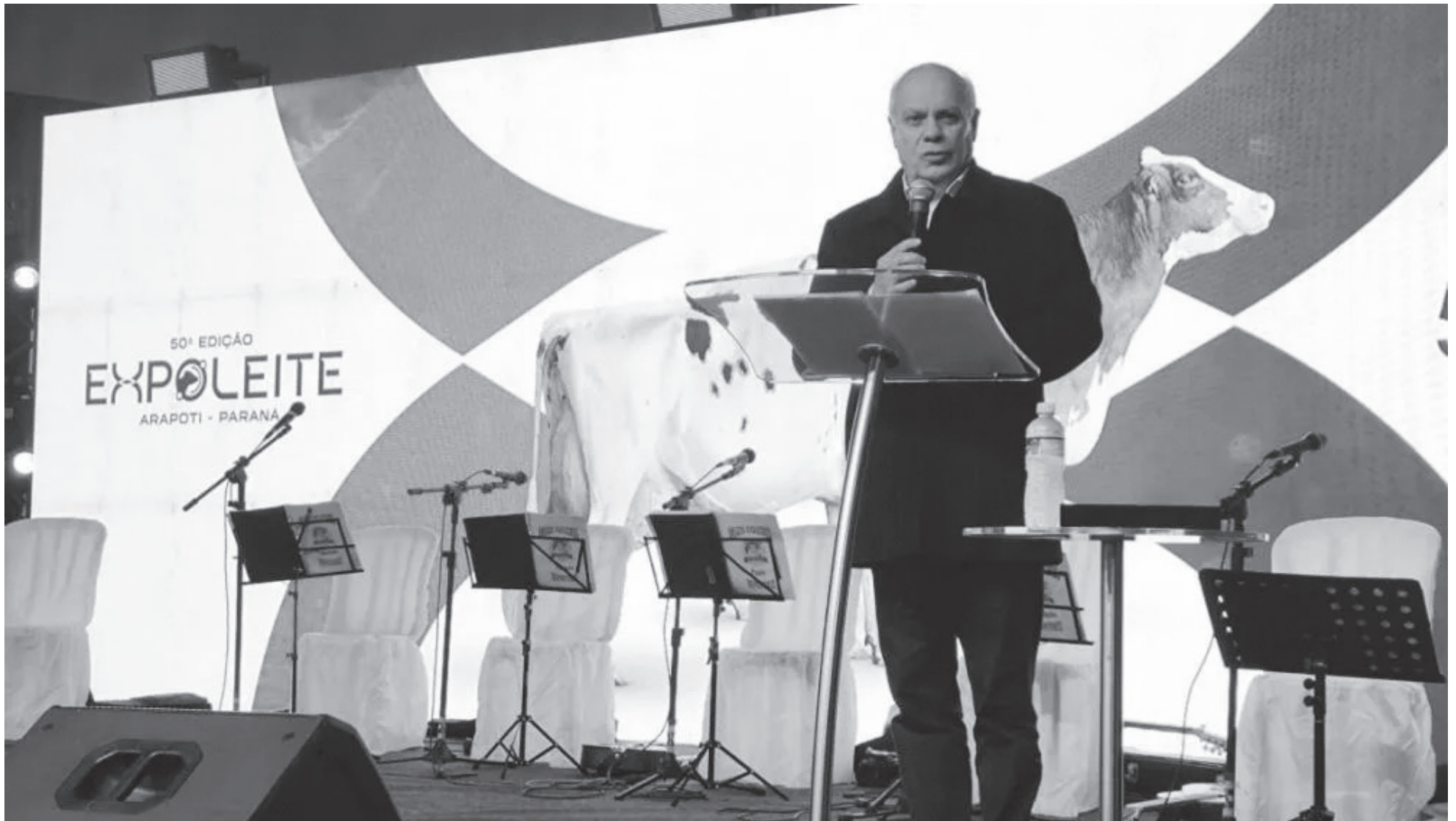
Abertura da 50. a Expoleite, organizada pela Capal Cooperativa Agroindustrial, de Arapoti, na noite de quarta-feira (10) - Na foto, o secretário estadual da Agricultura e do Abastecimento (Seab), Natalino Avance de Souza

Capal Cooperativa anunciou que vai investir em melhorias nas instalações do Parque de Exposição em Arapoti no período de sete anos. Entre as atrações estão previstos lago, bosque e pista para caminhadas