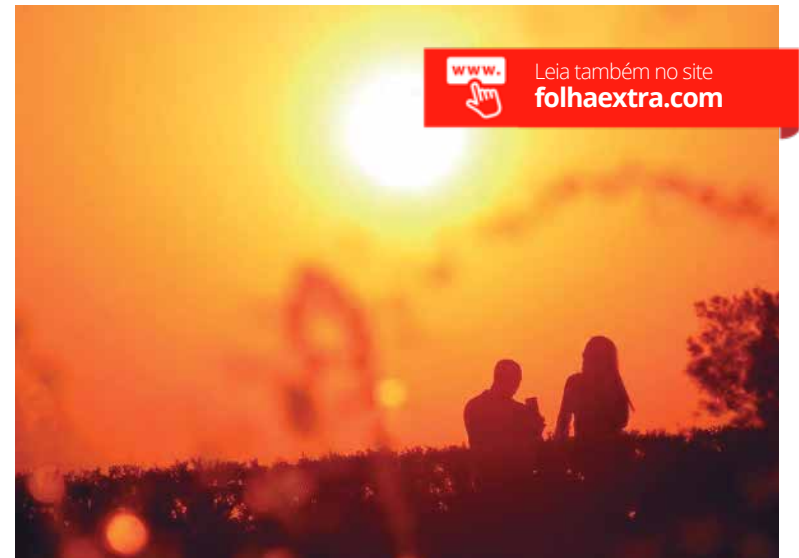
FOTO 1: Início do inverno pode ter clima seco, poucas chuvas e temperaturas acima da média da estação FOTO 2: Início do inverno pode ter clima seco, poucas chuvas e temperaturas acima da média da estação

Sanepar, eleita a melhor empresa de saneamento do mundo. Excelência e cuidado com os paranaenses.