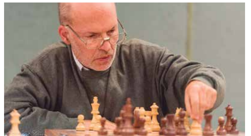
Mestre de Xadrez Henrique Costa Mecking, conhecido como Mequinho