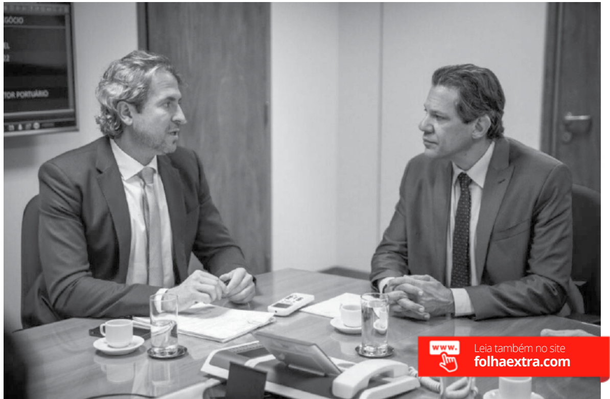
Zeca Dirceu em reunião com o ministro da economia Fernando Haddad

Os produtores terão a oportunidade de contrair empréstimos até 30 de junho, com taxas de juros de 8% ao ano e um prazo de 60 parcelas. Além disso, haverá uma carência de 24 meses para o pagamento da primeira parcela.