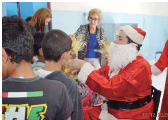
Papai Noel realizando a entrega dos presentes as crianças