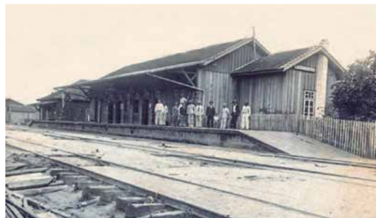
Ramal brazense era considerada um dos mais importantes entroncamentos ferroviários

Apesar de hodiernamente o município não ter alcançado as expectativas projetadas na época, Wenceslau Braz, agora com W a frente de seu nome, certamente ainda carrega no sangue do povo brazense a característica de um povo trabalhador que segue caminhando pelo caminho do progresso.