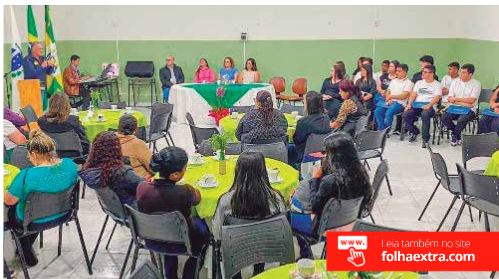
Foram entregues os diplomas para 17 anos do programa jovem aprendiz que concluíram o curso