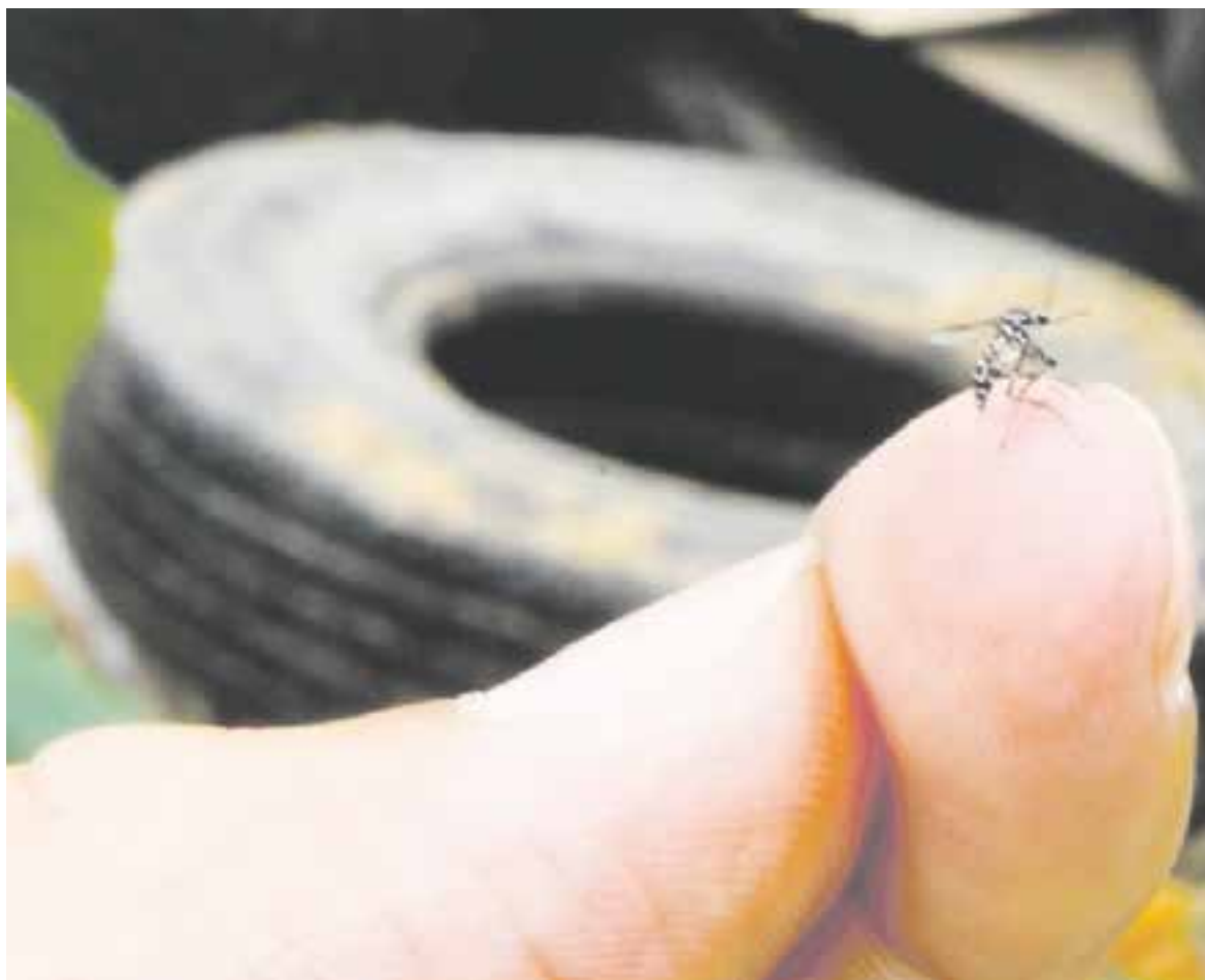
A principal maneira de prevenir a doença é combatendo a proliferação do Aedes Aegypti , transmissor da dengue, zika e chikungunya

Secretaria municipal de Saúde de Siqueira Campos aguarda o resultado de exames do Lacen para saber se o óbito da paciente que estava internada foi causado pela doença