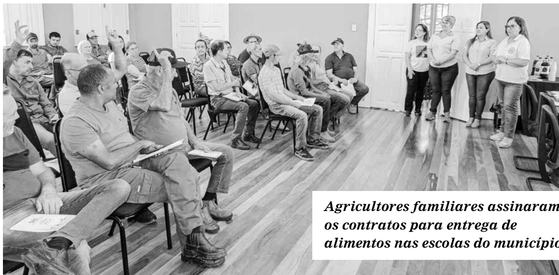
Agricultores familiares assinaram os contratos para entrega de alimentos nas escolas do município

Prefeitura compra frutas, verduras e legumes para garantir uma boa alimentação para os alunos e, de quebra, investe na agricultura familiar do município