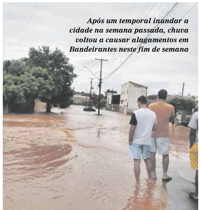
Após um temporal inundar a cidade na semana passada, chuva voltou a causar alagamentos em Bandeirantes neste fim de semana

Já em Siqueira Campos, as equipes da prefeitura estão trabalhando para realizar o levantamento dos problemas que surgiram com as chuvas. A análise está sendo feita de