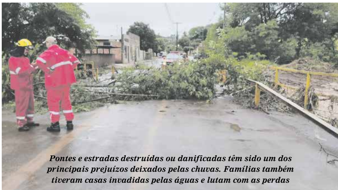
Pontes e estradas destruídas ou danificadas têm sido um dos principais prejuízos deixados pelas chuvas. Famílias também tiveram casas invadidas pelas águas e lutam com as perdas

maneira individual de acordo com o caráter emergencial de cada situação. O município também registrou pontos de alagamentos e danos a estruturas de algumas ruas. Segundo o prefeito Luiz Henrique Germano, a prioridade dos trabalhos será na recuperação de ruas, pontes e estradas de maior movimento. Em Pinhalão, a equipe do prefeito Dionísio Arrais de Alencar segue realizando trabalhos de recuperação de estradas rurais, pontes e estruturas da zona urbana do município que também foram danificadas devido as chuvas das últimas semanas. O Centro de Eventos do município e as estradas rurais foram os mais afetados. Todas as secretarias municipais seguem mobilizadas para realizar os trabalhos emergenciais. A prefeitura chegou a cogitar a busca pelo decreto de situação de emergência, mas até o momento a informação não foi confirmada.