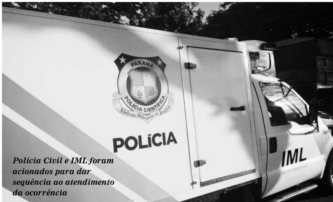
Polícia Civil e IML foram acionados para dar sequência ao atendimento da ocorrência