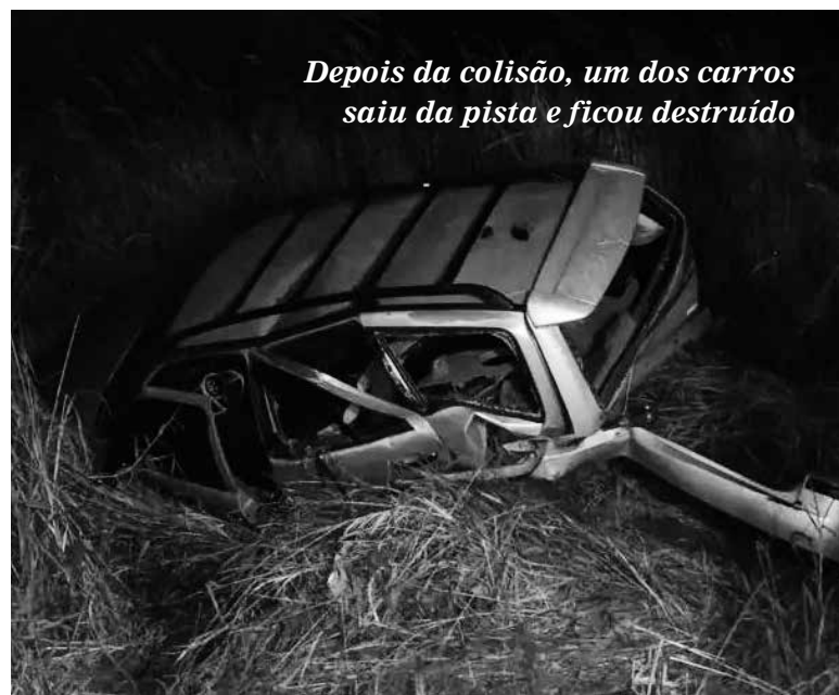
Depois da colisão, um dos carros saiu da pista e ficou destruído

A mulher de 38 anos que conduzia a Parati e uma passageira de 22 anos ficaram feridas, assim como o homem de 52 anos que dirigia o Gol. Os três feridos foram socorridos pela equipe do SAMU (Serviço de Atendimento Móvel de Urgência) e foram encaminhados ao Pronto Socorro de Bandeirantes para receber atendimento médico.