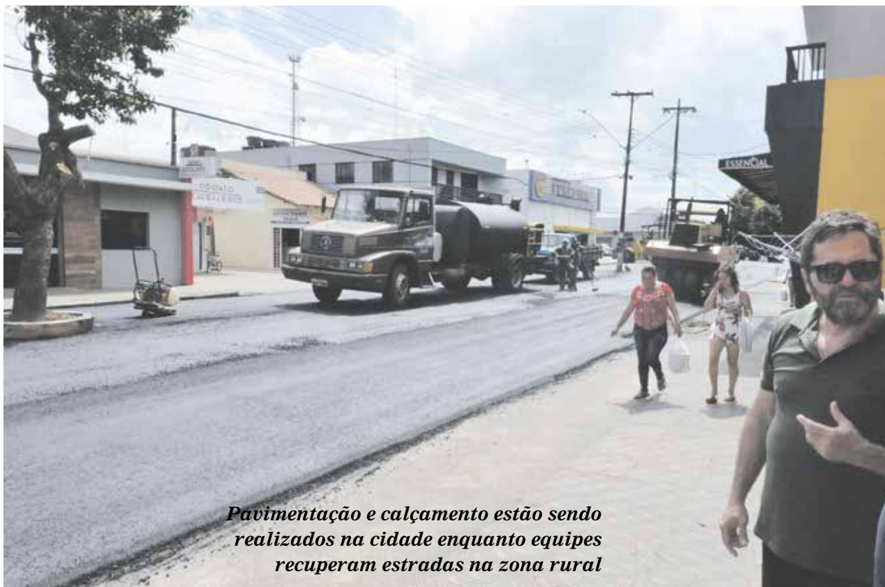
Pavimentação e calçamento estão sendo realizados na cidade enquanto equipes recuperam estradas na zona rural

Reportagem da Folha conversou com Taidinho que comentou sobre as ações que estão sendo realizadas em diferentes setores para atender a população do município