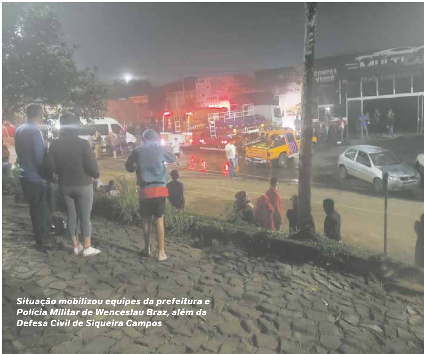
Situação mobilizou equipes da prefeitura e Polícia Militar de Wenceslau Braz, além da Defesa Civil de Siqueira Campos