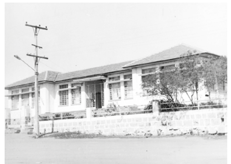
Antiga estrutura do Colégio Doutor Sebastião Paraná