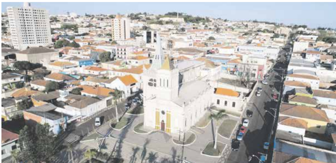
Caso mais recente registrado pela Sesa é de paciente de Siqueira Campos

A transmissão ocorre por contato próximo com lesões, fluidos corporais, gotículas