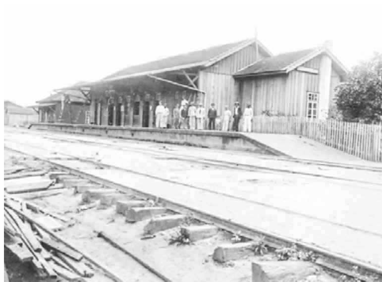
Estação Ferroviária em meados de 1920