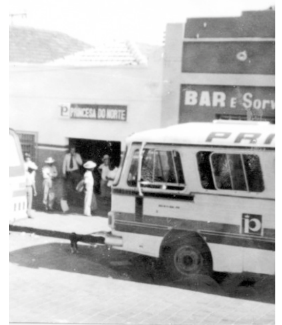
Antigo ponto da viação Princesa do Norte

Apesar de muita coisa ter mudado do passado para agora, o município continua sendo um dos mais queridos da região, sempre lembrado com carinho pelos ex-moradores.