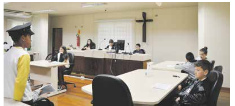
Após a visita, alunos apresentaram um júri simulado, onde representaram casos de injustiça e deram vereditos finais de sentença

Estiveram presentes na ocasião funcionários, autoridades do Fórum e a Ordem Dos Advogados do Brasil, com os advogados, Larissa Apare-