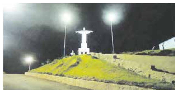
Mirante do Cristo Redentor