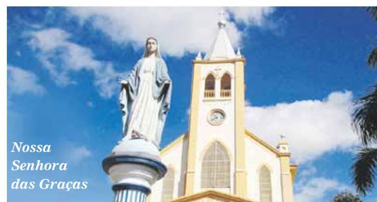
Nossa Senhora das Graças