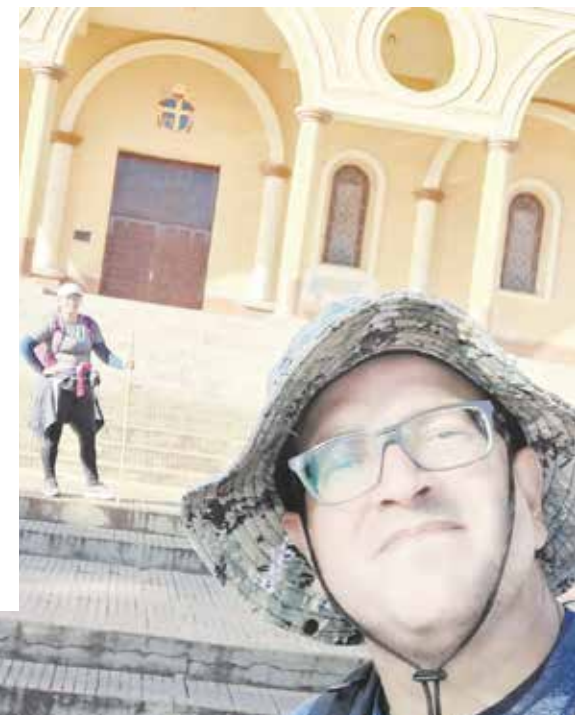
Casal se juntou a milhares de peregrinos que visitaram o santuário nesta semana