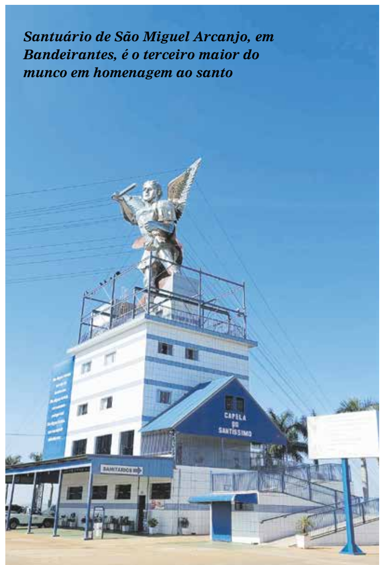
Santuário de São Miguel Arcanjo, em Bandeirantes, é o terceiro maior do mundo em homenagem ao santo

No local, os fiéis ainda encontram atendimentos para pedidos de orações, missas, lojas de lembranças e lanchonete para receber os peregrinos.