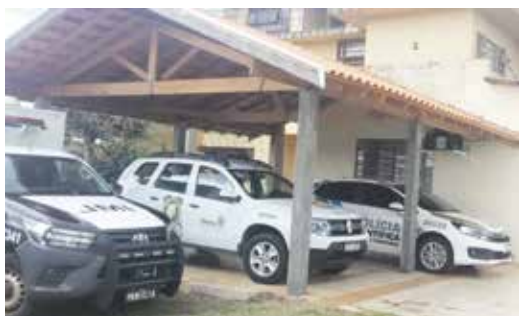
Instituto Médico-Legal de Jacarezinho