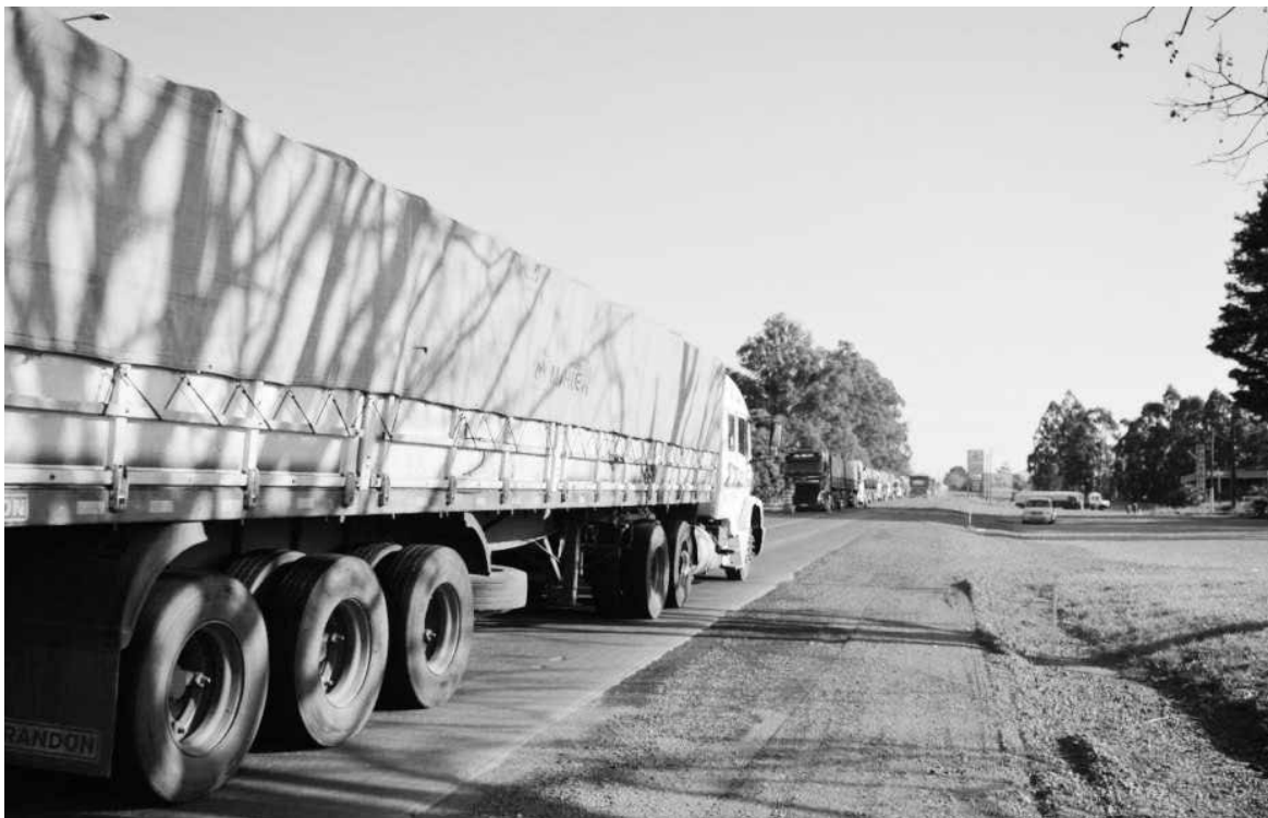
Rodovia já vem recebendo melhorias, como o caso da inserção de novos trechos de terceiras faixas entre Jaguariaíva e o entroncamento com a BR-153

O governo do Paraná, através do Departamento de Estradas de Rodagem, vai realizar um grande investimento para obras de conservação e manutenção na PR-092, rodovia alvo de reclamações dos usuários devido ao estado da pista.