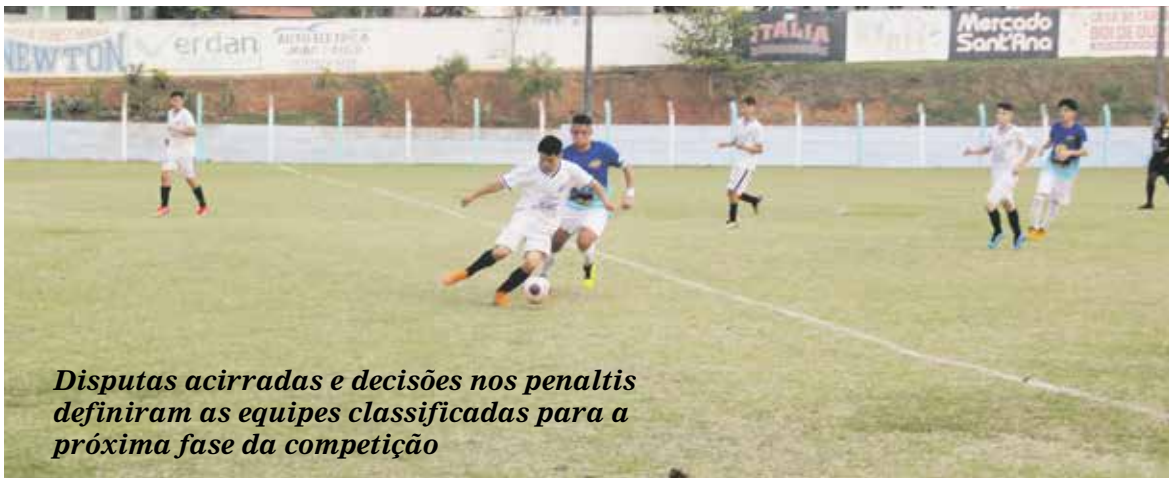
Disputas acirradas e decisões nos penaltis definiram as equipes classificadas para a próxima fase da competição

O município de Santana do Itararé foi palco da segunda fase regional da 68ª edição dos Jogos Escolares do Paraná Bom de Bola. O Estádio Municipal Prefeito José de Oliveira recebeu os atletas das escolas que fazem parte do Núcleo Regional de Educação de Wenceslau Braz para as disputas dos jogos que definiram os classificados para a próxima fase do torneio que deve ser disputada no fim do mês em Japira.