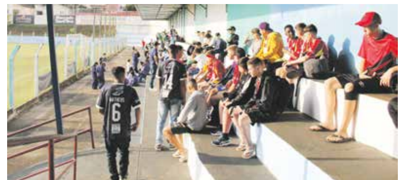
Público compareceu e fez a festa na arquibancada na torcida dando apoio as equipes dentro de campo