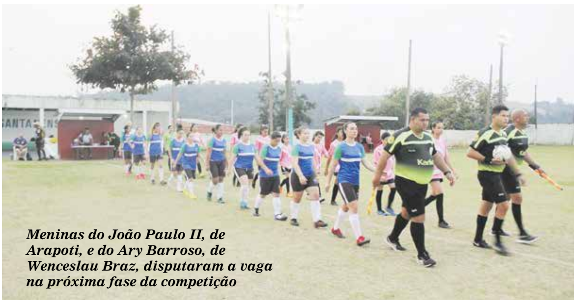
Meninas do João Paulo II, de Arapoti, e do Ary Barroso, de Wenceslau Braz, disputaram a vaga na próxima fase da competição

Os Jogos Escolares do Paraná são uma realização do Governo do Estado, por meio da Secretaria da Educação e do Esporte e da Superintendência Geral do Esporte. O evento conta com o fundamental apoio dos Núcleos Regionais de Educação e da Prefeitura Municipal de Santana do Itararé.