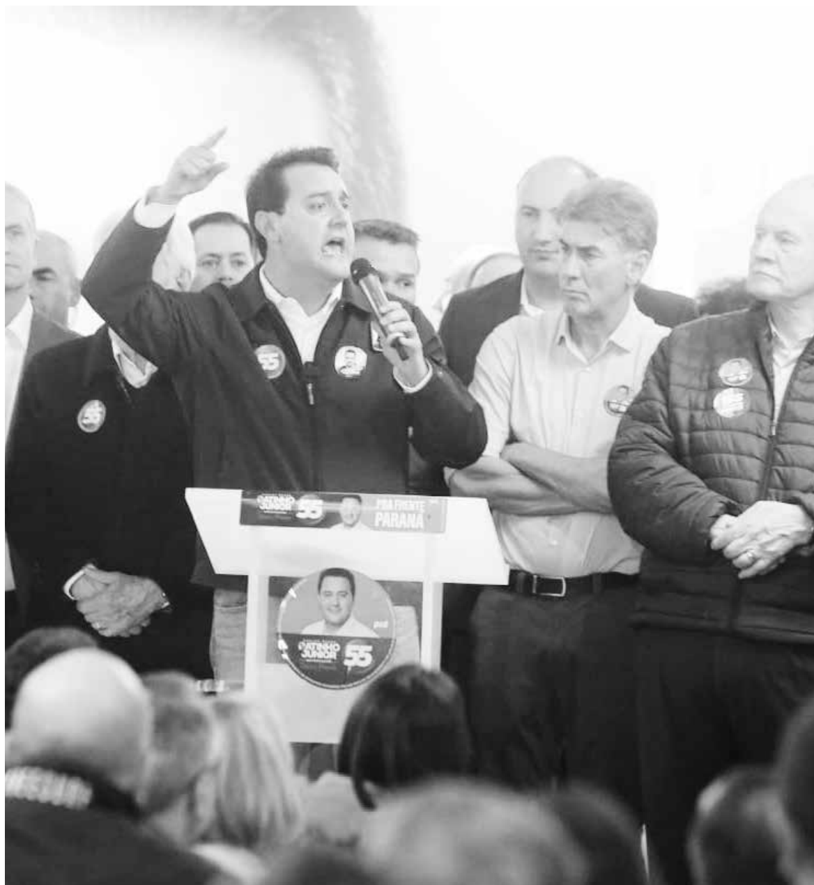
Candidato a reeleição segue otimista com o apoio de prefeitos de diferentes regiões do Paraná

“Com a construção de casas populares, tarifas sociais de água e energia e programas como o Cartão Comida Boa, o governador mostra a sua sensibilidade com as famílias mais carentes, que em grande parte são chefiadas por mulheres”, declarou a prefeita.