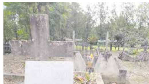
Há quem diga que o local é mal Assombrado até hoje

CEMITÉRIO DOS POLONESES – Joaquim Távora: Na cidade de Joaquim Távora um dos locais que inspiravam histórias é o Cemitério dos Poloneses, cujo as ruínas estão situadas no bairro Nova Varsóvia, zona rural do município. Lá eram enterrados poloneses e lituanos que residiam no bairro, mas com o tempo os enterros passaram a ser realizados no cemitério municipal e o local ficou abandonado. Há quem diga que é mal assombrado, resta ter coragem para realizar uma visita e comprovar se o fato é verdadeiro.