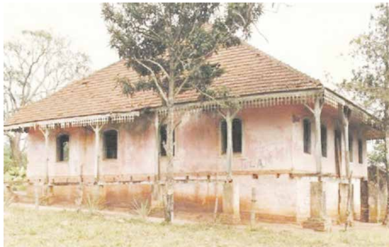
Estrutura que ficou marcada na memória de muita gente atualmente deu lugar as ruínas

Atualmente a estrutura da casa já não é mais a mesma. A velha e imponente casa acabou dando lugar às ruínas, o que não deixa de despertar a curiosidade e até medo de quem passa pelo local.