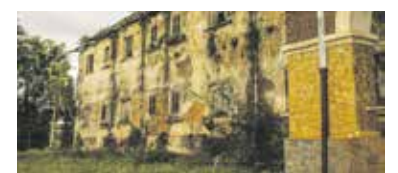
Hotel é marcado por histórias assustadoras

O local foi inaugurado na década de 1950 e ficou famoso atraindo gente de todo canto devido as propriedades milagrosas das águas encontradas no terreno. Tinha, inclusive, uma das maiores piscinas do país. A lenda prega que o proprietário teria feito um pacto para o sucesso do empreendimento que tinha até mesmo um cassino, situação que acabou lhe causando uma doença fazendo com que ele amputasse as pernas. Quando o “Coisa Ruim” veio busca-lo, e ele morreu. Na vida real, o fato foi tratado como suicídio. A “praga” tomou ainda mais proporção quando seu filho, herdeiro do hotel, morreu em um acidente de carro após assumir o empreendimento. Coisas estranhas como incêndios, portas abrindo e fechando sozinha, barulhos e ruídos acabaram se tornando histórias que deram ao local o título de mal assombrado.