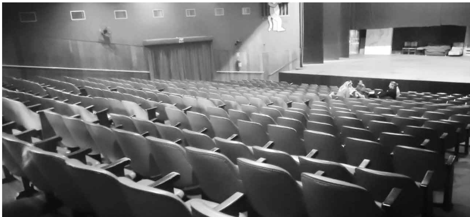
Em Jacarezinho, a reunião acontece hoje às 19h00 no Conjunto Amadores de Teatro