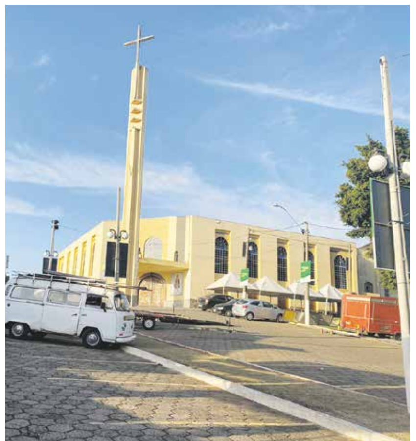
Santuário teve espaço ampliado com tendas para que os fiéis possam acompanhar as missas