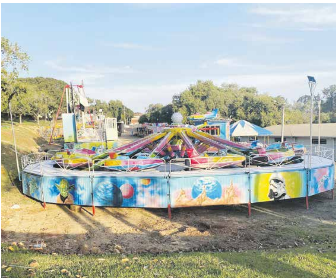
Parque de Diversões, barracas de produtos e alimentos já estão montados para atender ao público entre 28 de julho e 07 de agosto