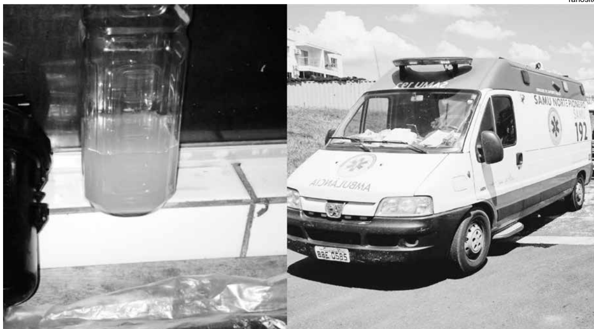
A esquerda, o combustível analisado, constado alto teor de água. A direita, viatura ambulância do Serviço

O Serviço de Atendimento Móvel de Urgência (SAMU), de Santo Antonio da Platina vem há alguns meses tendo verdadeiros “abacaxis” na unidade. Primeiro em relação aos pagamentos dos funcionários, em consequência da antiga empresa administradora, OZZ, depois pelas viaturas que constantemente eram mandadas para manutenção. Após todo transtorno com a antiga empresa, uma nova foi