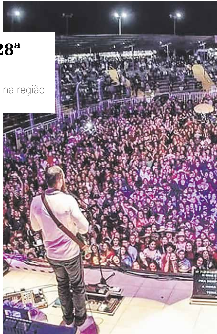
Organização não poupou esforços para garantir que o rodeio voltasse a ser realizado em grande estilo