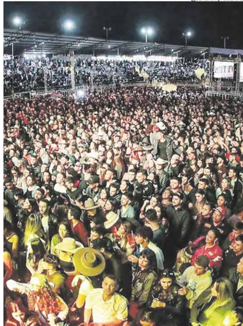
Arena ficou lotada pelo público que dançou e cantou ao som dos melhores artistas do cenário nacional