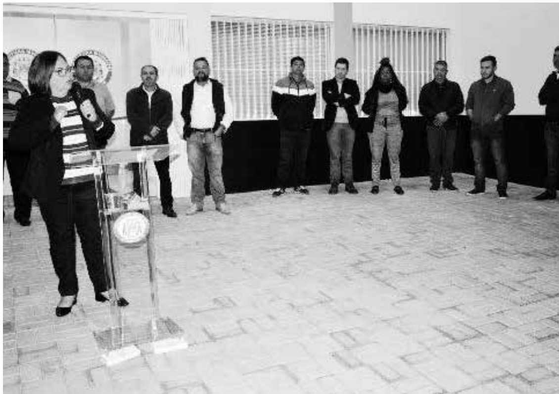
Cerimônia de entrega da nova sede da prefeitura municipal de Jaguariaíva

Na semana passada, a prefeitura municipal de Jaguariaíva, realizou a inauguração de um novo espaço de atendimento à população, a Regional Primavera. O novo local oferecerá atendimento em diversas áreas, facilitando o acesso da população