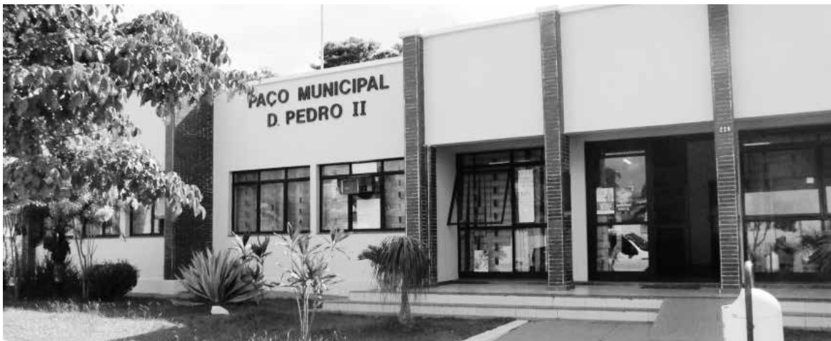
Quadro da prefeitura tavorense conta hoje com 423 servidores

Atualmente, a prefeitura de Joaquim Távora tem em sua folha de pagamento 423 servidores que já podem contar com o dinheiro em suas contas. Ainda de acordo com o Executivo Municipal, o pagamento da segunda parcela do 13º está programado para dezembro.