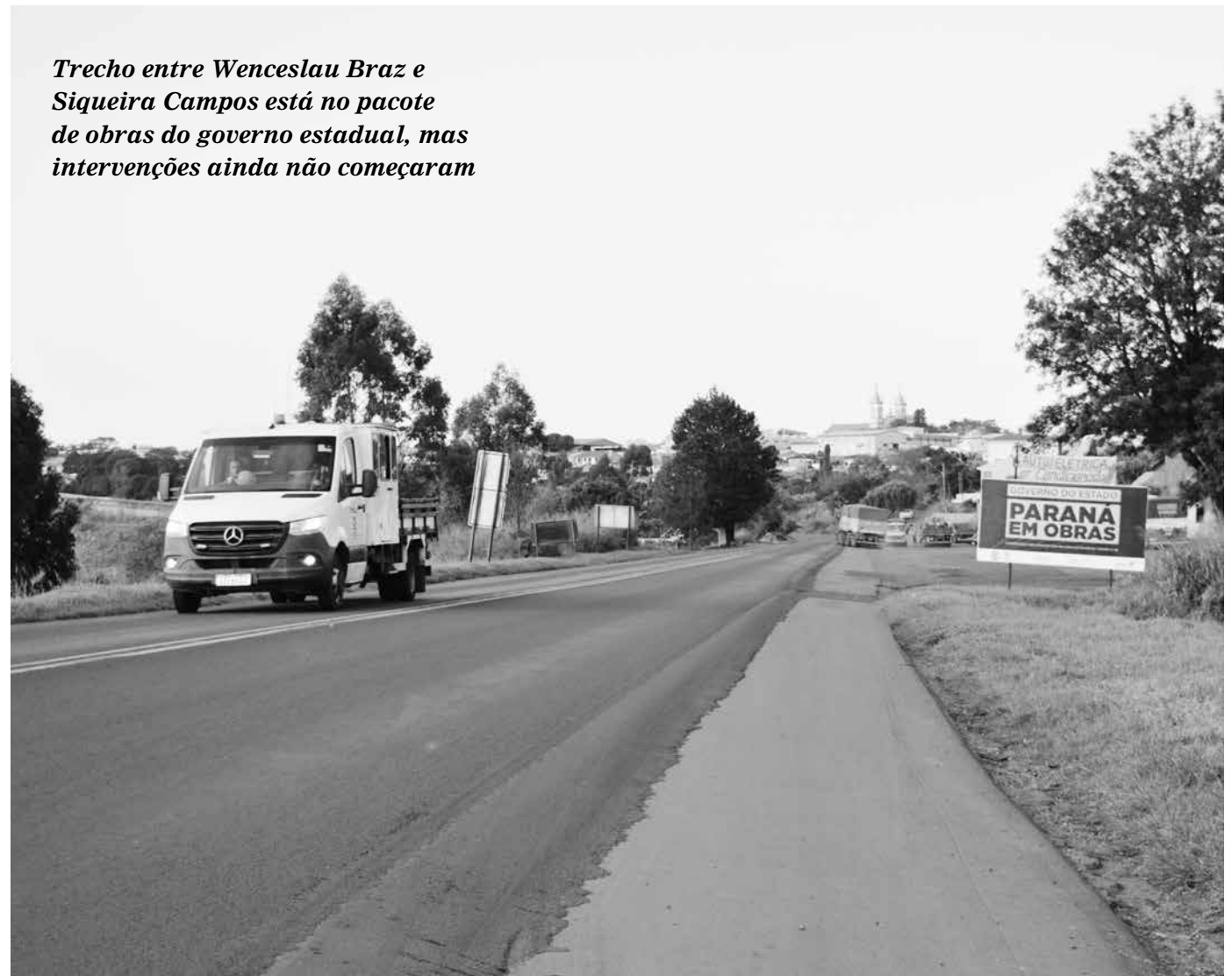
Trecho entre Wenceslau Braz e Siqueira Campos está no pacote de obras do governo estadual, mas intervenções ainda não começaram