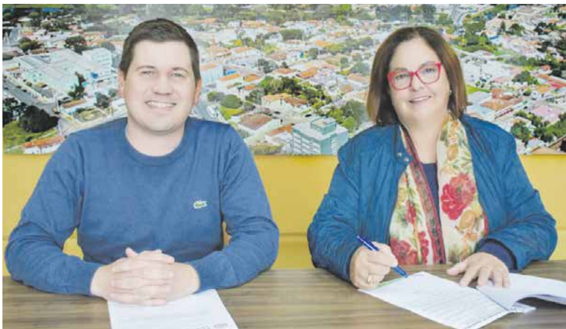
Prefeita Alcione Lemos e o chefe de governo Ghiovanny Lorusso na assinatura do Projeto de Lei para subsídio da passagem

Os novos valores devem começar a ser praticados assim que o projeto for aprovado pelos vereadores e que forem cumpridos os trâmites necessários.