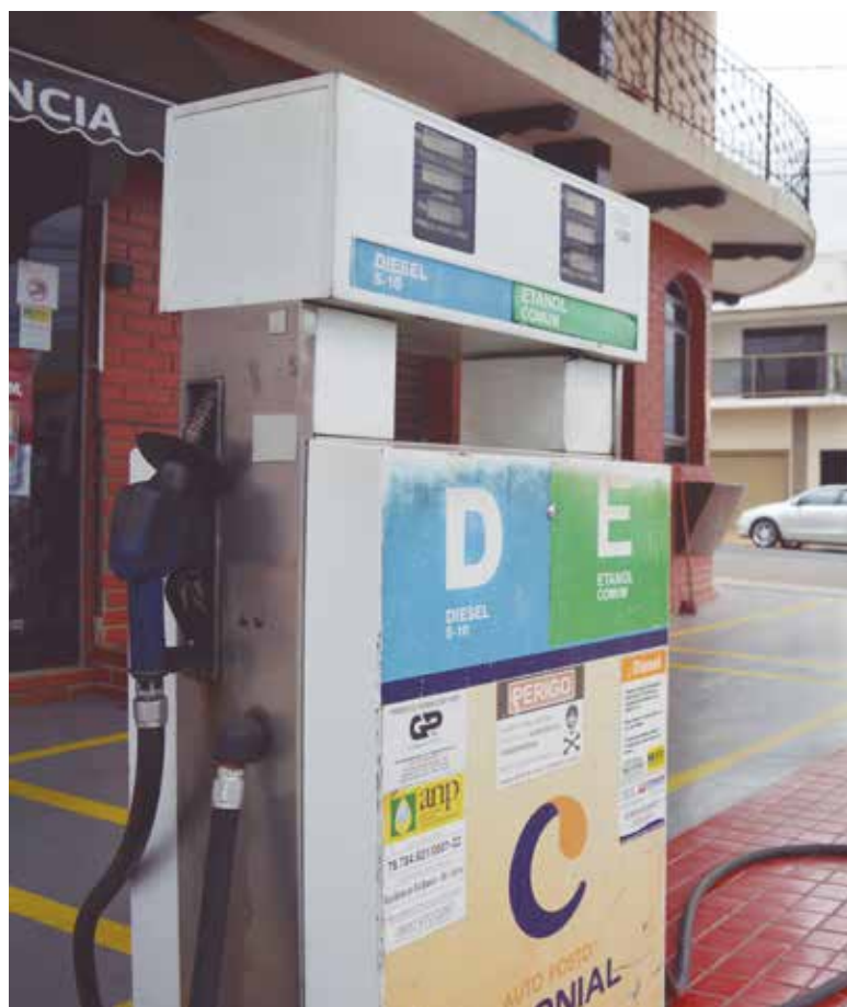
Preço médio da gasolina em maio deste ano foi de R$ 7,29 conforme levantamento da ANP