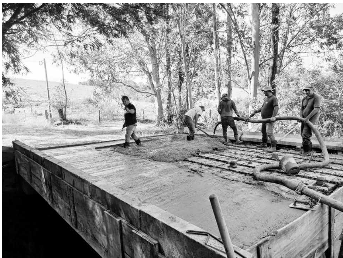
Obras de concretagem da nova Ponte no bairro Água Branca

Na semana passada, o prefeito do município de Jaboti, Regis William, fez um resumo dos investimentos e obras que estão sendo realizados no município, com destaque para os recursos para área da Saúde e sobre o título de Capital do Morango para a cidade.