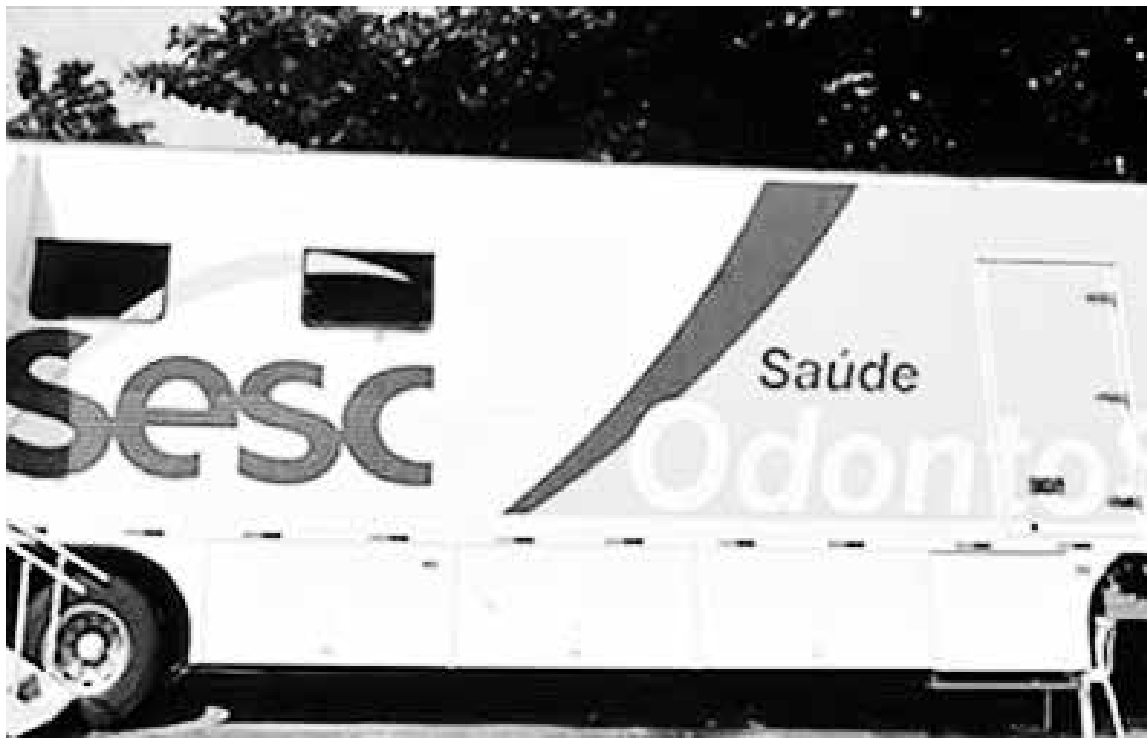
Japira recebe Carreta Odontológica do SESC para distribuir atendimento gratuito para população

Ainda de acordo com o boletim informativo, o município totaliza desde o início da pandemia 7.400 casos ativos da doença, 6 mortes pela doença no ano de 2022 e 168 mortes desde o início da pandemia. A boa notícia é que os casos ativos tiveram uma queda considerável saindo de 300 positivados para 49, que é o número atual de pacientes com a doença, além disso, não há nenhuma pessoa com a suspeita do vírus ou aguardando resultados laboratoriais.